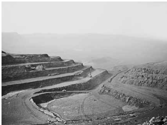
Phosphat-Mine Bou Craa.

Erste spanische Handelsniederlassungen an der Küste der Westsahara gab es schon im 15. Jahrhundert. An der Berliner Konferenz von 1884/85 wurde dann die Vorherrschaft Spaniens über das Gebiet der Westsahara von den europäischen Mächten offiziell anerkannt. In den folgenden Jahren regelten weitere Abkommen zwischen Frankreich und Spanien die gegenseitigen Einflussbereiche. Damit war auch die Grenze der spanischen Kolonie Sahara festgelegt. Die Präsenz der Spanier blieb aber im Wesentlichen auf die drei Handelsniederlassungen von Tarfaya, Villa Cisneros und La Guera beschränkt. Bis 1934 unternahm Spanien praktisch nichts, um das Landesinnere zu kontrollieren. Die Bevölkerung der Westsahara blieb mehr oder weniger unabhängig.