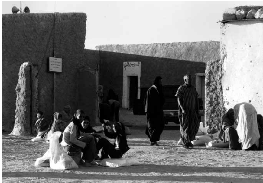
Lebensmittelverteilung im Lager Tifariti.