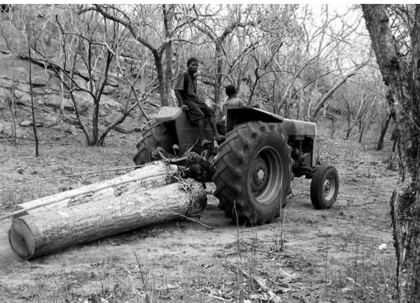
An zu vielen Orten werden zu viele Bäume geschlagen. Wenn es so weiter geht, sind die Waldressourcen von Mozambique in spätestens 10 Jahren am Ende.

Der Grossteil der Konzessionen geht nicht an lokale Industrien, sondern an kleine Gewerbetreibende. Diese arbeiten mit asiatischen Exporteuren zusammen, die im Hafen von Quelimane tätig sind und die Kredite bereitstellen, die für die Zahlung der Lizenzgebühren benötigt werden. Diese kleinen Forstunternehmer sind alle Mozambiquaner. Es sind jedoch so viele (über 150 im Jahr 2003), ihre Aktivitäten unterliegen so wenig Kontrolle und ihre Reinvestition in den