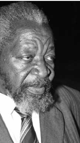
Malangatana Valente Ngoenha, 1936–2011 (Bild: Jornal Noticias, Mosambik).

em. Am frühen Morgen des 5. Januars 2011 verlor die Welt kurzfristig ihre Farben. Der grösste mosambikanische Maler erlag im Alter von 74 Jahren den Folgen einer langen Krankheit. Geboren unweit der Hauptstadt Maputo, wuchs Malangatana bis zum zwölften Lebensjahr bei seiner Mutter auf. Sie ernährte ihre Familie u. a. mit dem Erlös aus der Dekoration von Kalebassen, während der Vater als Wanderarbeiter in Südafrika weilte. Als Hirtenjunge besuchte Malangatana erst mit elf Jahren eine von Schweizer Missionaren gegründete Schule. Später wusch und bügelte er für einen portugiesischen Haushalt und arbeitete als Balljunge in einem Tennisclub. Dort lernte er den Biologen Augusto Cabral und den berühmten Architekten Pancho Guedes kennen, die ihn als Maler förderten. Mit 25 Jahren hatte Malangatana seine erste Einzelausstellung, die ihm gleich den Durchbruch verschaffte. 1964 steckte ihn die portugiesische Kolonialregierung wegen seiner Nähe zur nationalistischen Bewegung für 18 Monate ins Gefängnis.