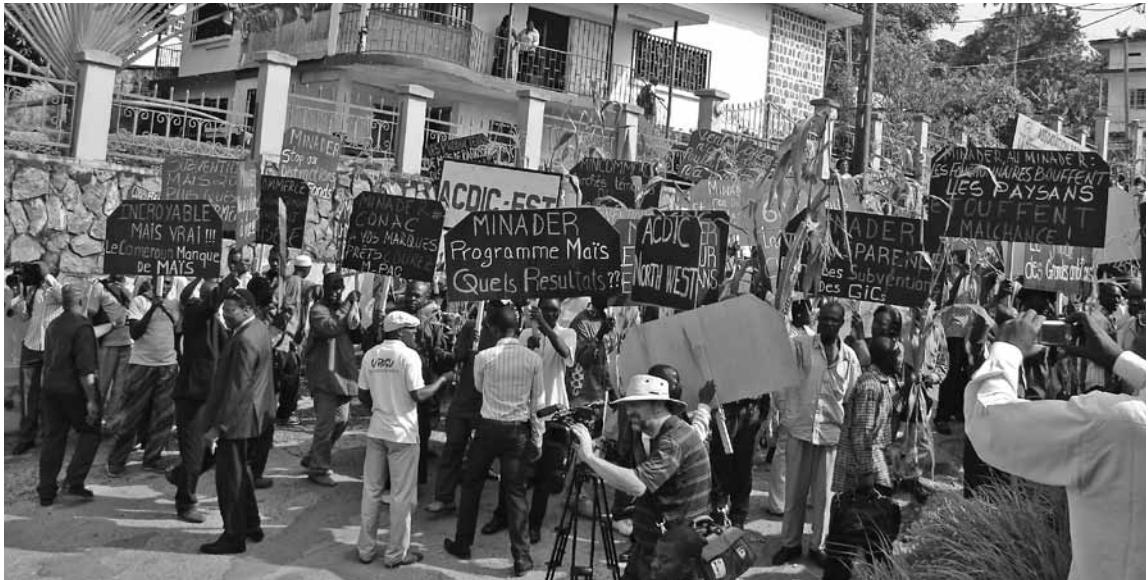
Die Kameruner Bürgerbewegung ACDIC mobilisiert die Stadtbevölkerung für eine bauernfreundlichere Politik und gegen den Import von Nahrungsmitteln.

Sind autonome Bauern- und Konsumentenorganisationen ein Ausweg aus der Blockade der afrikanischen Landwirtschaftspolitik? Bernard Njonga koordiniert die Plattform nichtstaatlicher Akteure im zentralen Afrika. Er schildert die Entstehung der autonomen Bauernorganisationen, ihre Beziehungen zu den Regierungen und zur Entwicklungszusammenarbeit, sowie ihre Schwierigkeiten und Probleme. Zumindest in Kamerun fordern inzwischen auch Konsumentenorganisationen eine neue Landwirtschaftspolitik von der Regierung.