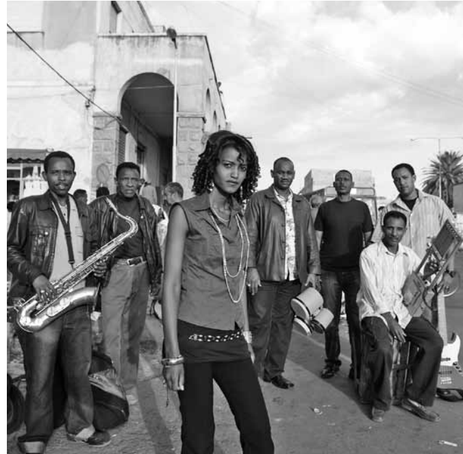
Die Asmara All Stars.