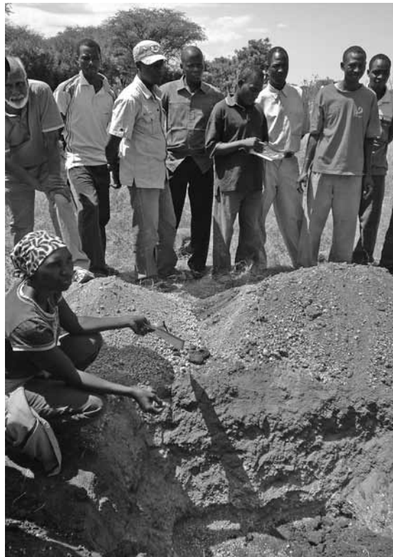
Ausbildung von Beratern und Bauern in Tansania zur Verbesserung der Bodenfruchtbarkeit. Die negativen Folgen des Klimawandels, die Afrika besonders stark betreffen, können durch gutes Bodenmanagement und ökologisches Design der Landnutzung in Bezug auf die Ertragssicherheit etwas aufgefangen werden.

Das FiBL arbeitet seit einem Jahr an einem grösseren, mehrheitlich von der Bill und Melinda Gates Stiftung finanzierten Projekt, welches Ausbildungswerkzeuge im Biolandbau Afrikas verbessern und die entsprechenden Institutionen stärken soll. Wir setzen somit direkt an einer zentralen Schwachstelle des Systems an: dem Orientierungswissen der Bauern und Bäuerinnen. Diese sollen eine Chance erhalten, sich direkt mit Verfahren und Techniken auseinanderzusetzen und die für sie richtigen Entscheide zu treffen. Markt- und Managementwissen werden integriert und Videos sowie Radioprogramme als moderne Medien genutzt. Das Wissen selbst wird mit den Bauern und ihren Vertretern in ausgewählten Ausbildungs- und Beratungsinstitutionen generiert und getestet. Auf der Forschungsebene betreibt das FiBL seit 2006 einen Langzeitversuch in Kenia, der konventionelle und biologische Modelle vergleichend untersucht und sowohl physikali-