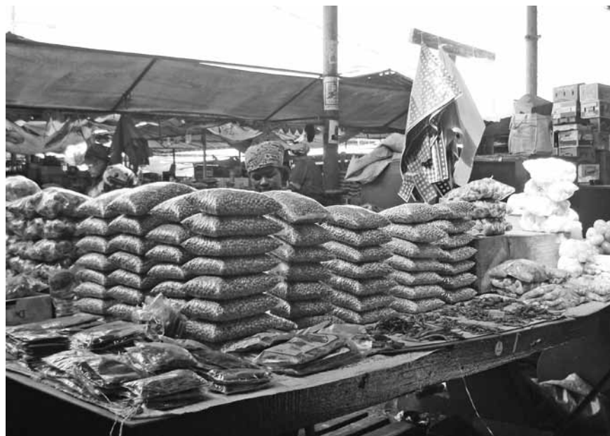
Marktfrauen in Maputo. Cashew-Nüsse sind ein mosambikanisches Produkt, doch 30 Prozent der im Land produzierten Lebensmittel kommen nicht bei den Verbrauchern an. Stattdessen werden viele Lebensmittel aus Südafrika importiert.

Leonie March ist freie (Radio-)Korrespondentin in Südafrika und berichtet regelmässig über das ganze südliche Afrika. Der Artikel wurde erstmals im Mosambik-Rundbrief Nr. 81 abgedruckt. Kontakt: leonie.march.fm@dradio.de