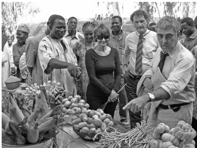
Besichtigung der Rizière Boulbil bei Ouagadougou im Rahmen eines Afrika-besuchs von Aussenministerin Micheline Calmy-Rey, rechts im Bild Philippe Fayet (Bild: EDA 2009).

Im Verlaufe dieser Entwicklungen glaubte die Entwicklungszusammenarbeit stets, eine entscheidende Rolle spielen zu können, und dass sie der unumgängliche Antrieb der Innovationen sei und bleibe. Anstatt Foren des Gesprächs und der Abstimmung zwischen Staat und Bürgern zu fördern, hat sie ihre besonderen Beziehungen zu den Regierungen gepflegt. In diesem Umfeld beschäftigt man sich jedoch eher mit der Wirksamkeit, Ausrichtung und Harmonisierung der Hilfe als mit dem, was bei der ländlichen Entwicklung auf dem Spiel steht. Diese Haltung – durch die Erklärung von Paris erneut auf den Schild gehoben – gibt den Erstbetroffenen nur wenig Raum.