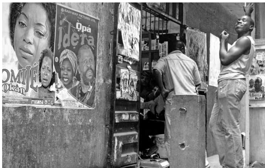
Nigerias Filmindustrie ist produktiver als jene der USA. Von jedem Film werden im Durchschnitt 50 000 Kopien verkauft. Filmstill aus der Dokumentation Nollywood Babylon.

Eine einfache Antwort scheint es nicht zu geben, dennoch steht die Frage immer wieder im Raum: Was ist afrikanischer Film? Sind es die sozialrealistischen schwarz-weiss Klassiker des Altmeisters Ousmane Sembène? Sind es die künstlerischen Filmprojekte der jungen urbanen Generation in den afrikanischen Metropolen? Ist es Nollywood, die zweitgrösste Filmindustrie der Welt, die in so vielen afrikanischen Ländern die Bildschirme dominiert? Sind es Autoren- und Arthouse-Filme berühmter RegisseurInnen wie Abderrahmane Sissako? Sind es surreale nouvelle-vague Experimente wie