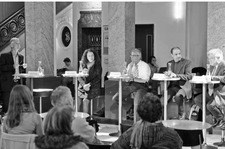
Auf bescheidenes Publikumsinteresse stiess diese Debatte zum Thema Wirtschaftsinteressen vs Globale Gesundheit im Unternehmen Mitte.

va. Vom 4. bis 28. Oktober 2011 zeigte das Zentrum für Afrikastudien Basel im Kollegienhaus der Universität die audiovisuelle Wanderausstellung «Die andere Seite der Welt». Diese wurde im März 2011 erstmals in Bern gezeigt und ist seither in allen Landesteilen zu sehen. Die Ausstellung bietet Einblick in unzählige Video-Interviews mit Menschen, die sich in den letzten 50 Jahren in der Entwicklungszusammenarbeit und humanitären Hilfe engagiert haben. Die BesucherInnen haben die Möglichkeit, individuell und gemäss ihren spezifischen Interessen durch eine per Zufallsgenerator zusammengestellte Auswahl von Video-Sequenzen zu navigieren. Oder sie können dies als Kollektiv tun, wobei die Auswahl der Sequenzen per Knopfdruck und Mehrheitsentscheid erfolgt. Die Idee dahinter ist, dass der Abstimmungsprozess das Gespräch über die Relevanz von Themen stimuliert.