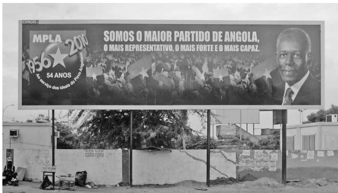
Die MPLA mag die grösste Partei in Angola sein, doch strafen die jüngsten Proteste ihre Slogans Lügen. Bild: Jon Schubert 2011.

Die Demonstration findet seit elf Uhr vormittags auf dem Unabhängigkeitsplatz Praça da Independência, mitten in Luanda statt. Am späten Nachmittag erst – etwa um 17 Uhr – fahre ich mit dem Sammeltaxi am Demonstrationsort vorbei. Hunderte Uniformierte der Polícia Nacional säumen den Platz. Einige Hundert junge Männer halten Transparente in die Höhe und skandieren Slogans wie: «Heute Gaddafi – morgen JES!» Im Sammeltaxi läuft angolansischer Kuduro und Rap aus den Armenvierteln mit radikalen Texten gegen die Staatsmacht, gegen die Parteibonzen der MPLA, gegen die Generäle, gegen den Präsidenten und sein «korruptes System». In den zahllosen Sammeltaxis, die Tag und Nacht durch Luanda fahren, beherrschen die subver-